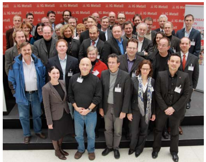
Fachkundiges Know-how für die betriebliche Praxis

Die Task-Force „Krisenintervention“ greift auf ein breit gefächertes Berater/-innen - Netzwerk zurück. Es umfasst mehr als 50 Beratungsunternehmen aus unterschiedlichen Disziplinen (Arbeitsrecht, Betriebs- und Personalwirtschaft), die je nach Problem fachkundige Lösungen für betriebliches Handeln einbringen können.